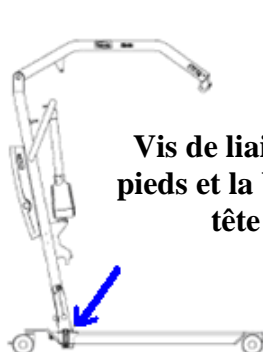
Vis de liaison entre les pieds et la base, 4 vis M8 tête fraisée

SI LES 4 VIS SE DEVISSENT MANUELLEMENT SANS FORCER A L'AIDE D'UNE CLE ALLEN M5, ALORS LE SERRAGE N'EST PAS CONFORME, IL FAUT CHANGER LA BASE. LE SERRAGE EST CONFORME SI VOUS NE POUVEZ PAS LES DEVISSER SANS FORCER.