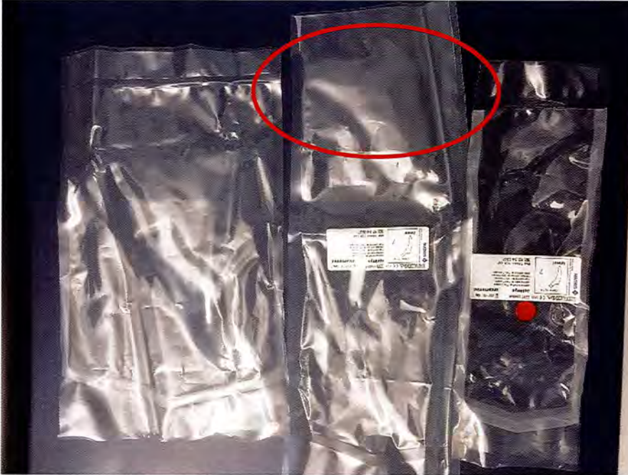
Figure 1: à gauche : emballage protecteur extérieur ; au centre : deuxième emballage pelable (1 e barrière stérile ou externe) avec couture soudée manquante ; à droite : troisième emballage pelable (2 e barrière stérile ou interne)

Mathys SA Bettlach a reçu des rapports du marché indiquant que la couture soudée du deuxième emballage pelable (1 e barrière stérile) est totalement absente.