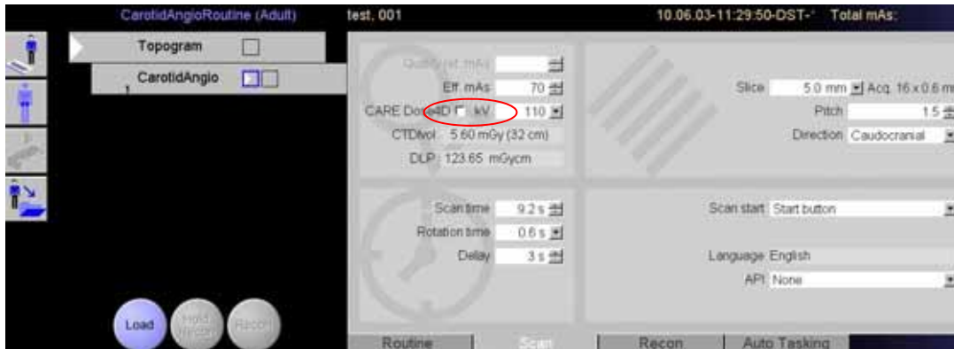
Fig. 1 : Désactiver la case CARE Dose4D

Étant donné que le topogramme PA ou AP est préférable dans des protocoles spécifiques tels que CarotidAngio (CarotideAngio) et RT_HeadNeckShoulder (RT_TêteCouÉpaule), nous vous recommandons vivement de désactiver la fonction CARE Dose4D pour ce type d'acquisition (Fig. 1).