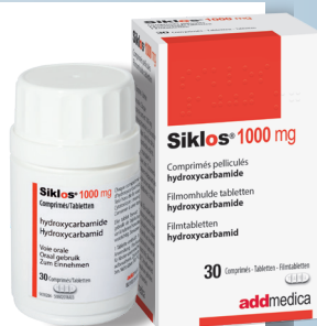
Boîte couleur ROUGE

Merci de bien vouloir présenter cette fiche à votre pharmacien avec l'ordonnance.