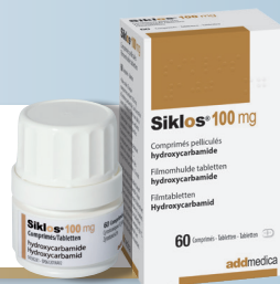
Boîte couleur OR