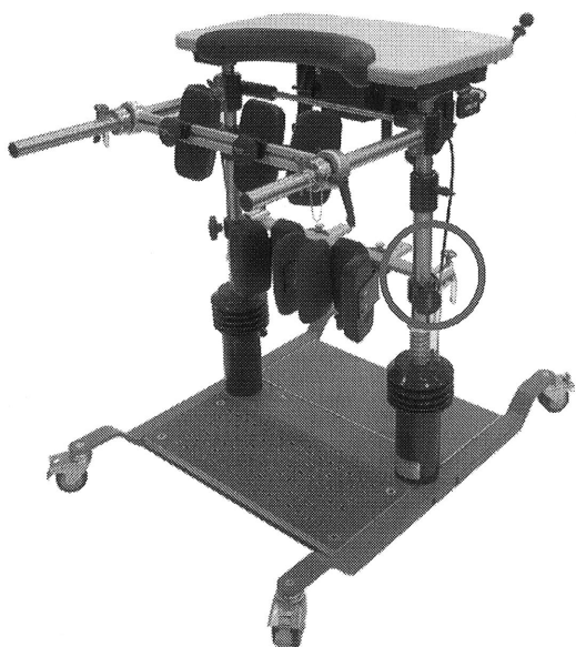
Illustration : THERA-Trainer balo

La goupille filetée de la suspension du support de genou est cassée.