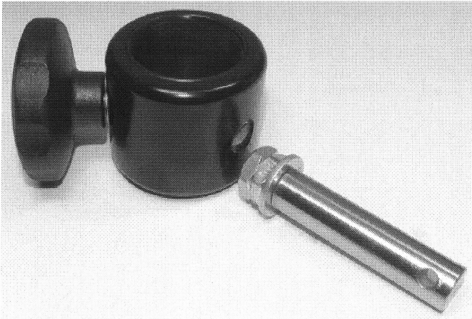
Illustration : rupture de la goupille

medica Medizintechnik GmbH Blumenweg 8 | 88454 Hochdorf