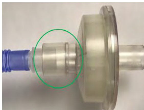
Figure 1 : Protection inspiratoire (ISG) CORRECTE