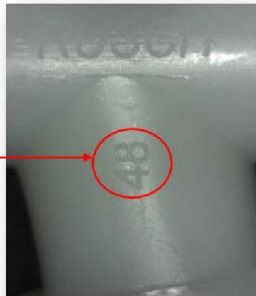
Figure 2 – Numéro d'identification