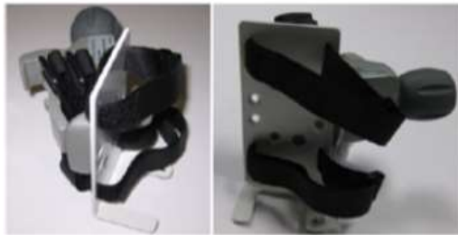
Figure 15-8 Support pour adaptateur de courant EV1000