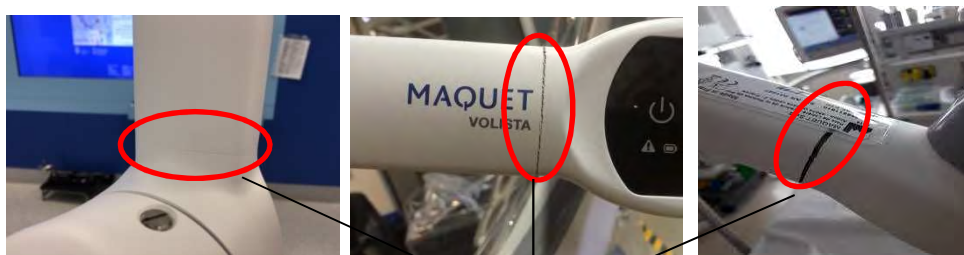
Photos de fissures du revêtement, de différentes tailles

Si vous repérez une fissure au niveau du revêtement de l'arceau, veuillez ARRÊTER D'UTILISER le dispositif et contacter votre représentant Getinge.