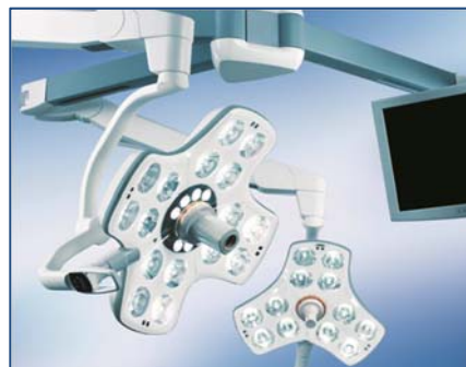
- Exemple d'Eclairage opératoire VOLISTA TRIOP -