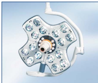
- Exemple de Coupole VOLISTA StanOP -