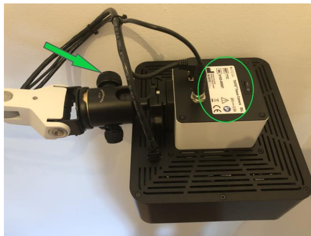
Figure 2: La flèche verte indique la vis sur la tête de balle qui doit être utilisée pour positionner la caméra ; le cercle vert indique la plaque signalétique sur laquelle vous trouverez le numéro de série

Veuillez remplir le formulaire de confirmation pour la réception de la lettre et la mise en œuvre des mesures et l'envoyer à l'une des personnes de contact énumérées ci-dessous.