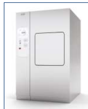
- Exemple de Stérilisateur Getinge -