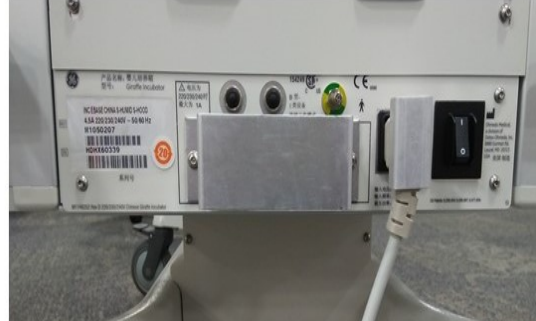
Figure 2 : le module d'oxygène asservi est installé Figure 3 : le module d'oxygène asservi n'est PAS installé