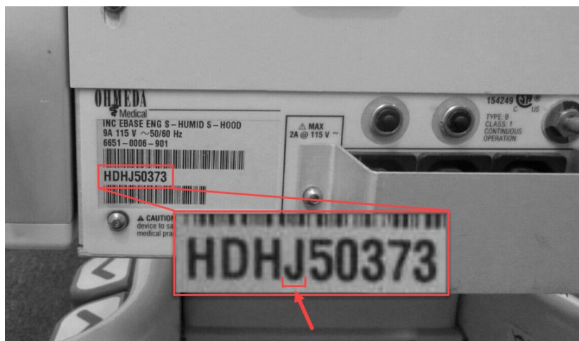
Figure 1 : étiquette du numéro de série, emplacement de la 4 e lettre