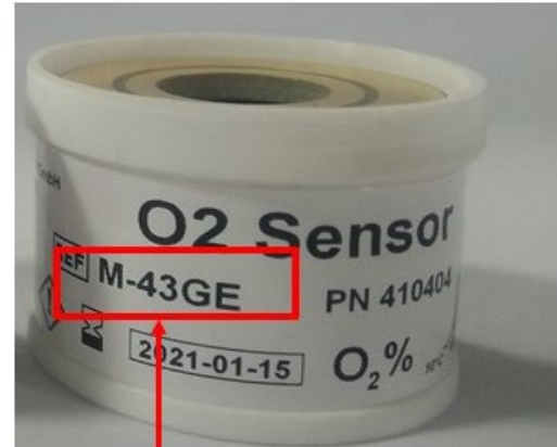
Figure 5 : référence du capteur d'oxygène : 6600-1278-600 Figure 6 : référence du capteur d'oxygène : M-43GE