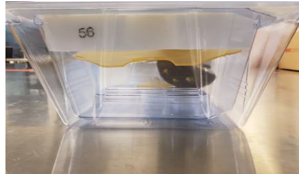
Figure 2 : implant hors de son socle

Veillez noter que Stryker travaille actuellement sur une amélioration de l'emballage destiné aux implants RAS, taille 54 à 68 mm.