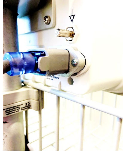
Avec cache de support

Si vous avez un système EV1000CS, qui combine les capacités des capteurs FloTrac et des manchons ClearSight, le système est alimenté par la pompe. Veuillez jeter le cordon d'alimentation fourni avec la plate-forme EV1000A, et utilisez uniquement l'alimentation à l'arrière de la pompe.