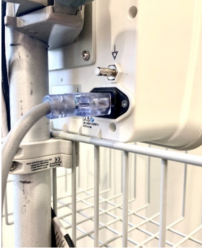
Sans cache de support