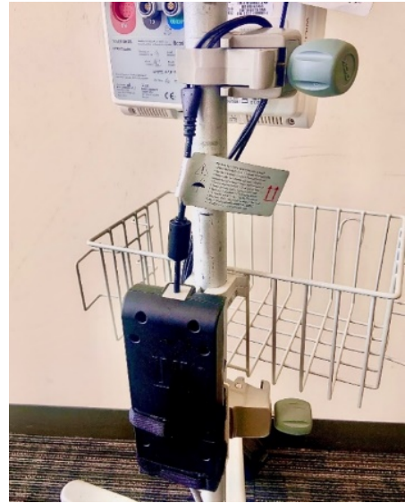
Alimentation avec cache