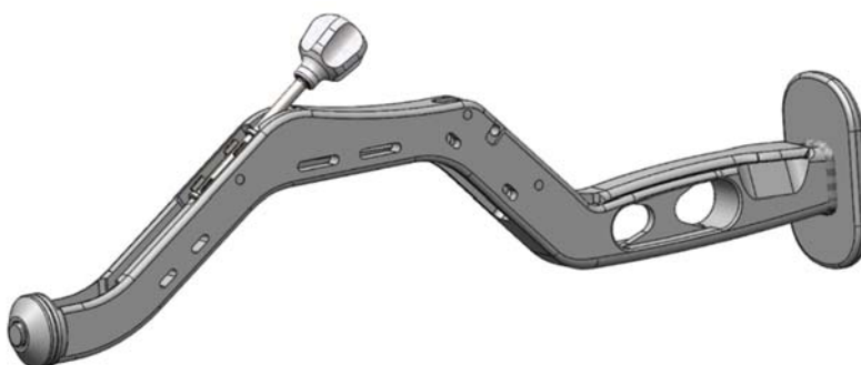
Porte cotyle décalé (tel qu'il est vendu)