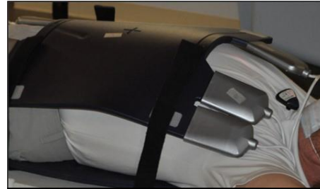
Figure 2 : Bobine pour torse avec boîtiers d'alimentation orientés en direction de la tête