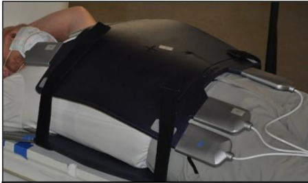
Figure 1 : Bobine pour torse avec boîtiers d'alimentation orientés en direction des pieds

La sécurité est au cœur de la politique de qualité de ViewRay. La priorité première de ViewRay est de résoudre sans tarder ces problèmes. Nous tiendrons nos clients informés dès que de nouvelles informations seront disponibles. En attendant, les clients sont invités à utiliser les séquences d'imagerie à 4 fps plutôt qu'à 8 fps et à suivre les conseils lors de l'utilisation de l'imagerie 3 plans.