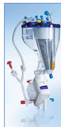
- Exemple de VKMO -