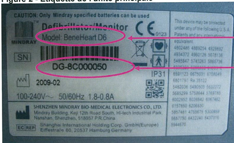
Figure 2 - Etiquette de l'unité principale