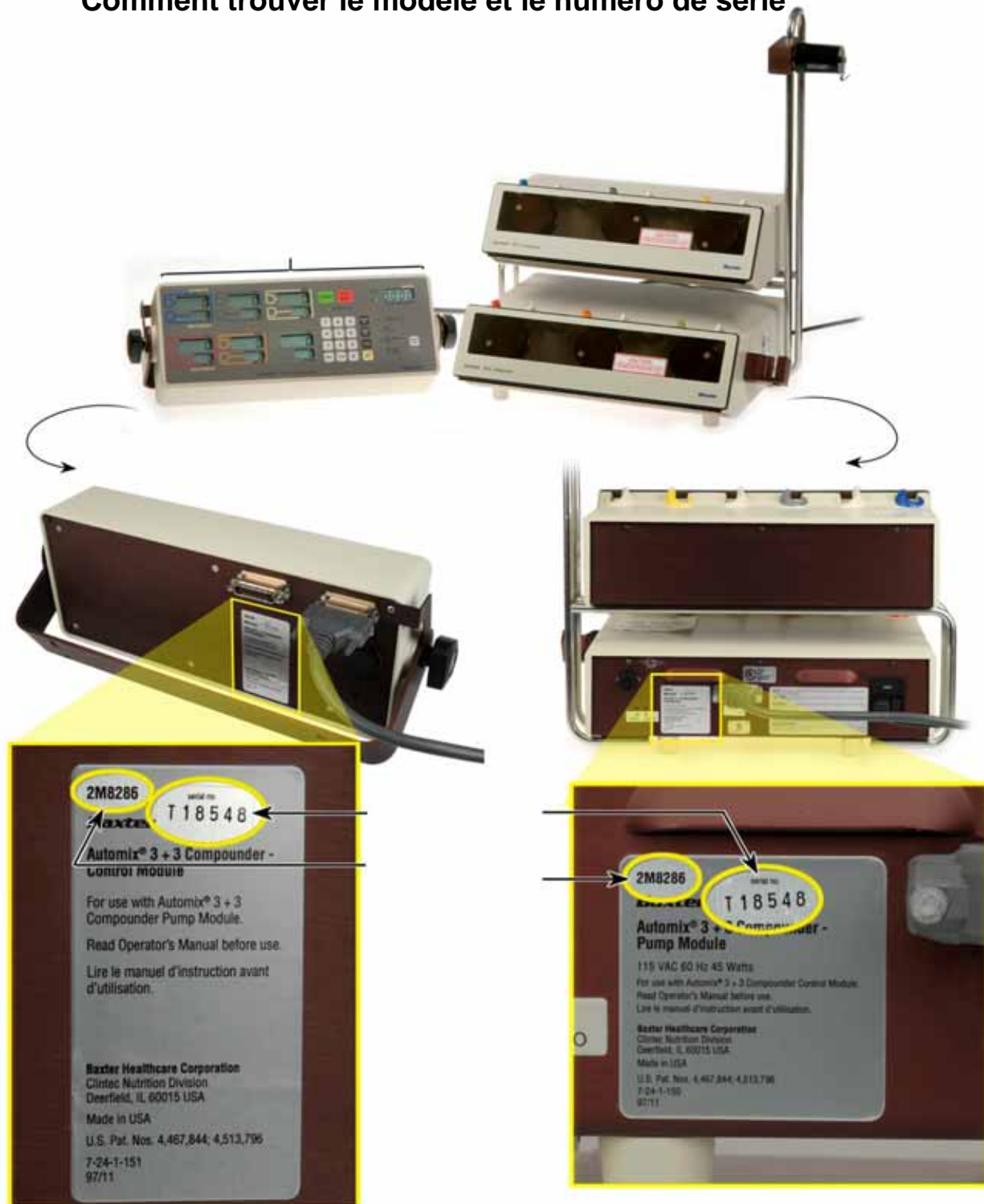
Figure n°2. Mélangeur AUTOMIX Comment trouver le modèle et le numéro de série

Baxter SAS 6, avenue Louis Pasteur – B.P. 56 F 78311 Maurepas Cedex Téléphone : 01 34 61 50 50 Télécopie : 01 34 61 50 25