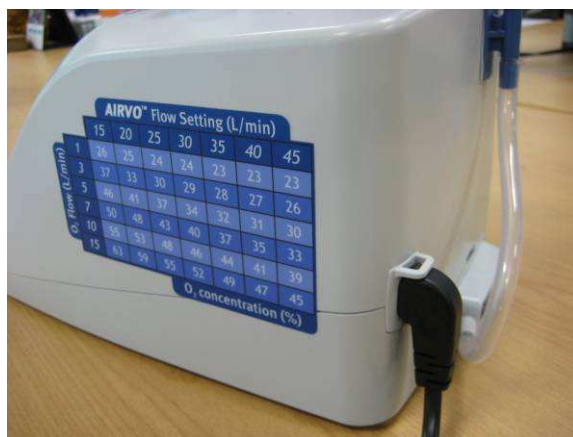
Figure 3. Unité d'AIRVO avec un nouveau cordon d'alimentation.