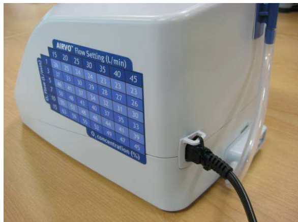
Figure 2. Unité d'AIRVO avec un ancien cordon d'alimentation.

Fisher & Paykel Healthcare remplace les cordons d'alimentation de toutes les unités affectées de PT100 (myAIRVO) et PT101 (AIRVO) par des cordons d'alimentation de remplacement alternatifs [Ref # 095542173] comme le montre les photos ci-dessous.