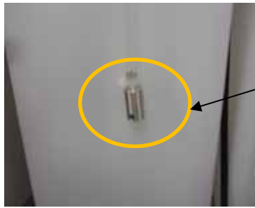
Contrepois à l'extrémité du tuyau

Pour éviter cette situation, nous vous demandons de bien vouloir vous assurer que le contrepois situé à l'extrémité du tuyau de détergent concentré atteint bien le fond du bidon.