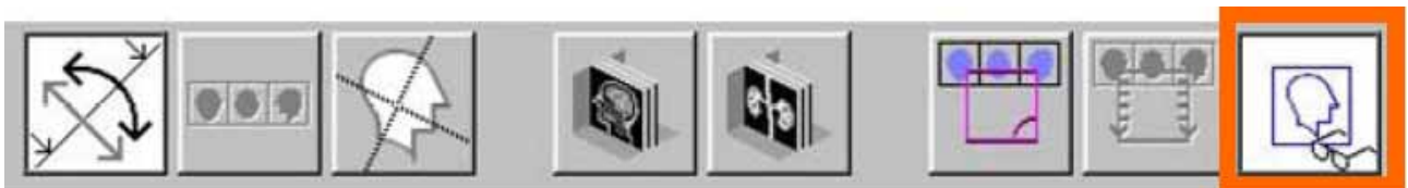
Fig. 2a : Barre d'outils Recon 3D : la fonction « Prévisualiser l'image » s'active d'un clic sur l'icône « Prévisualiser l'image » (cadre orange)