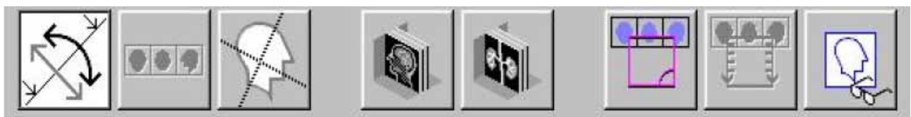
Fig. 2b : Barre d'outils Recon 3D avec fonction « Prévisualiser l'image » désactivée