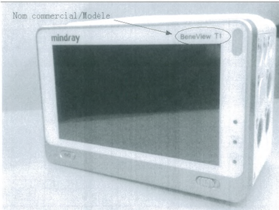
Figure 2 - Etiquette de l'unité principale