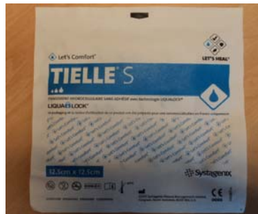
Le devant de la pochette