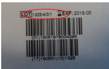
L'arrière de la pochette, montrant le numéro de lot (1325/X/X/X)