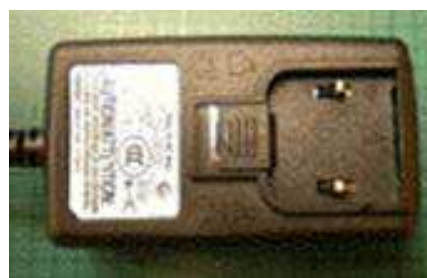
Partie à conserver (Bloc alimentation)

Nous vous remercions pour votre collaboration et vous prions d'accepter nos excuses pour la gêne occasionnée.