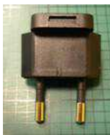
Partie à remplacer (prise)