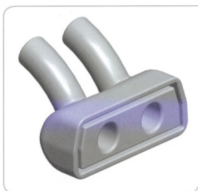
Figure 1 : Version précédente

FPH va remplacer toutes les Canules concernées de votre inventaire par la version précédente des Canules nasales de CPAP, ou émettre un avoir selon votre choix, à nous communiquer lors du retour du formulaire de réponse.