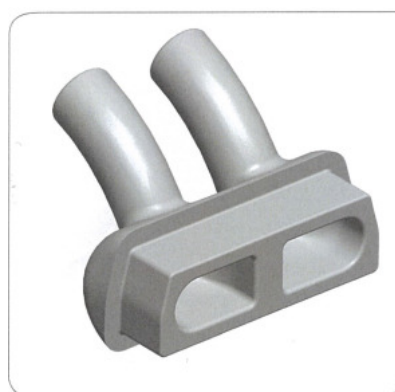
Figure 2 : Canules concernées