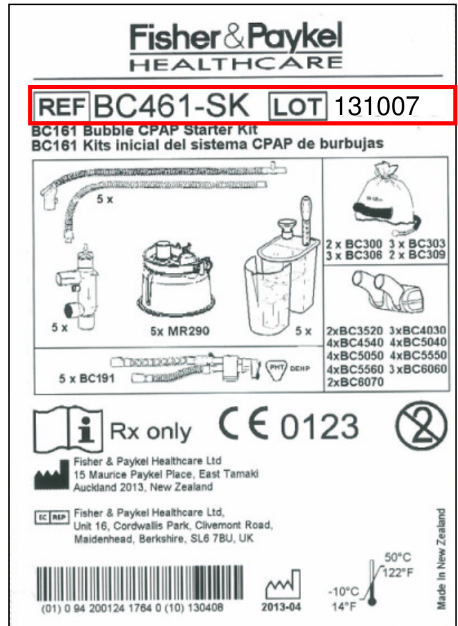
Figure 4 : Exemple d'étiquette de kit pour ventilation

Étape 2 : Détruisez les Canules concernées en les coupant en deux.