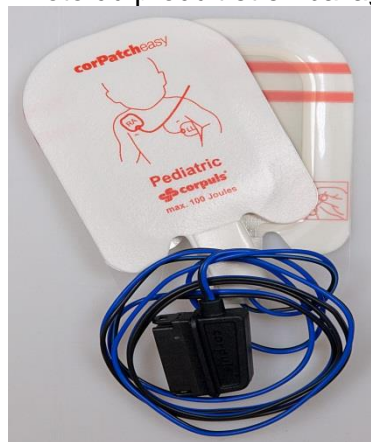
Photo du produit et emballage