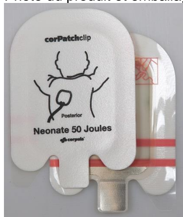
Photo du produit et emballage

04325.2 corPatch clip (Neonates) - Electrodes de défibrillation/stimulation pour clips 3M