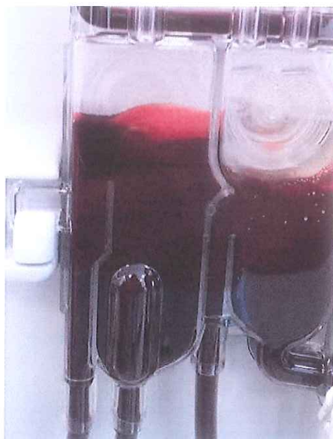
Quantité de mousse acceptable