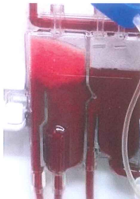
Quantité de mousse non acceptable