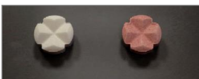
Ancien comprimé blanc et nouveau comprimé rose