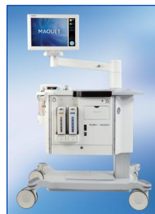
- Exemple de système d'anesthésie FLOW-i -