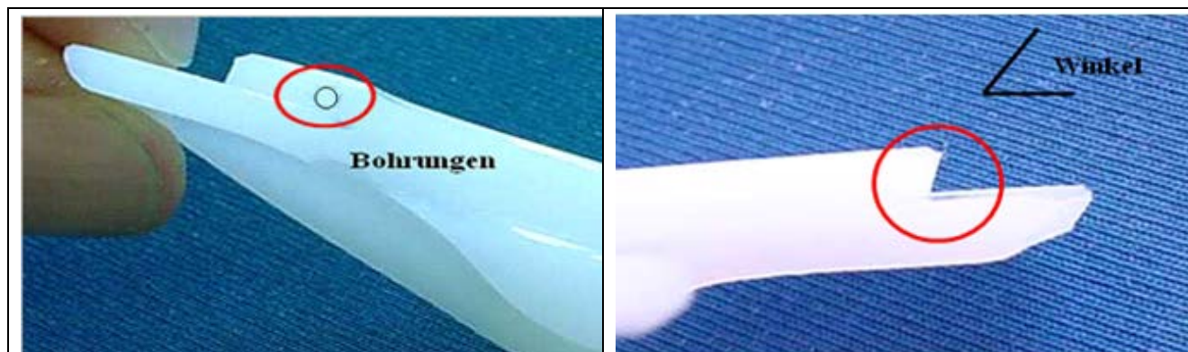
Illustration 1 : plateau tibial Endo-Modell ® , ancienne et nouvelle version

Le plateau tibial présentant l'ancienne forme (voir à gauche sur l'illustration 1) ne peut pas être combiné aux composants tibiaux présentant la nouvelle forme (voir à droite sur l'illustration 1) et inversement.