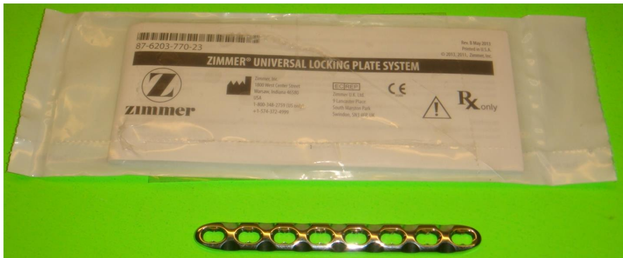
Exemple d'image de la plaque et de l'emballage retournés

Zimmer Biomet entreprend le rappel de plaques verrouillées non stériles, car il a été découvert, après examen de plaintes ouvertes pour des implants non stériles, que le produit indiqué sur l'étiquette de l'emballage ne correspondait pas au contenu de l'emballage. L'étiquette indiquait la référence 00-4936-011-13 (plaque de reconstruction verrouillée 3,5 mm, droite, 11 trous, 144 mm de longueur pour le Système de verrouillage Zimmer Universal) et le numéro de lot 62968956, alors que le produit à l'intérieur de l'emballage portait la référence 00-4936-008-07 (plaque de double compression verrouillée 3,5 mm, 8 trous, 105 mm de longueur pour le Système de verrouillage Zimmer Universal) et le numéro de lot 62968974. Zimmer Biomet rappelle tous les produits non utilisés présentant ces deux combinaisons de numéro de référence/numéro de lot. Le produit concerné a été distribué de février 2015 à juillet 2015. Aucune blessure ni aucun dommage n'a été signalé(e) concernant cette erreur.