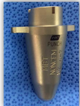
Figure 1 : Instrument Défonceur de quille pour genou SIGMA® High Performance (HP) M.B.T.

Depuis août 2013, environ 351 instruments concernés par ce rappel ont été distribués dans le monde. Ce rappel ne concerne pas d'autres lots ou instruments.