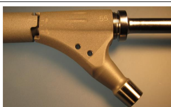
Photo 2 : Connexion partielle entre la tige proximale Revitan et l'impacteur modulaire Revitan REF 01.00409.800.