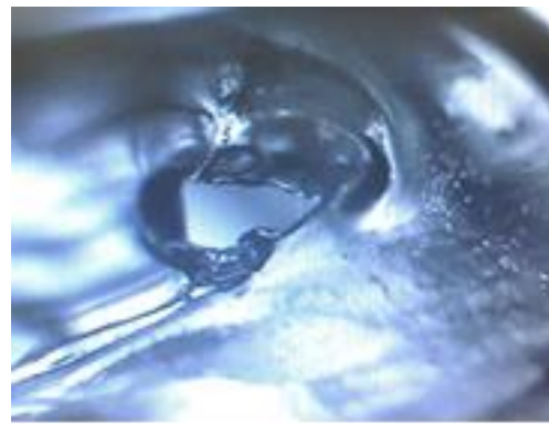
Trou dans la structure d'emballage interne grossissement x6