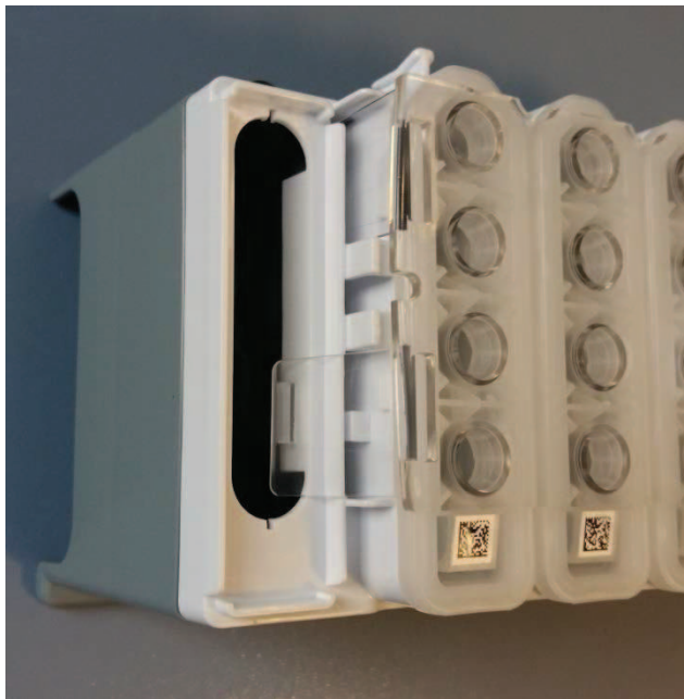
Positionnement incorrect du couvercle perforateur

En conséquence, le couvercle perforateur n'est pas enfoncé directement dans la cartouche de réactif défectueuse. Le couvercle perforateur est plutôt décalé sur le côté, vers le compartiment des billes. Par suite, le compartiment des billes se retrouve désaxé. Voir les images ci-dessous.