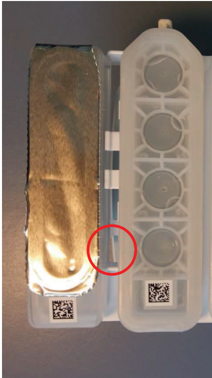
Support de cartouche de réactif défectueux