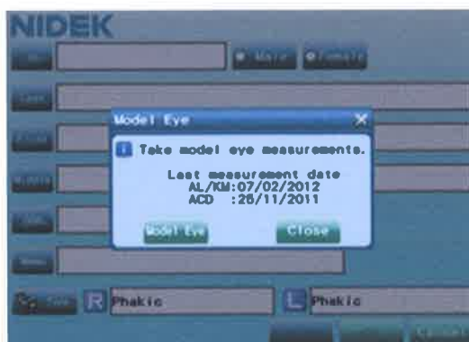
Fig.1 Affichage au démarrage de l'appareil

Pour une utilisation en toute sécurité, il est rappelé que la longueur axiale de l'œil test doit être mesurée lors de la mise en fonction de l'appareil comme le préconise le mode d'emploi et l'affichage du dispositif (Voir Fig.1). Si le résultat obtenu ne correspond pas à celui attendu, il est nécessaire de contacter Nidek.