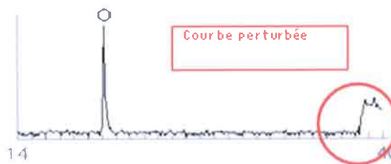
Fig.4 Perturbation de courbes (pic anormal)

Une courbe incorrecte indique que les conditions électromagnétiques d'utilisation sont anormales :