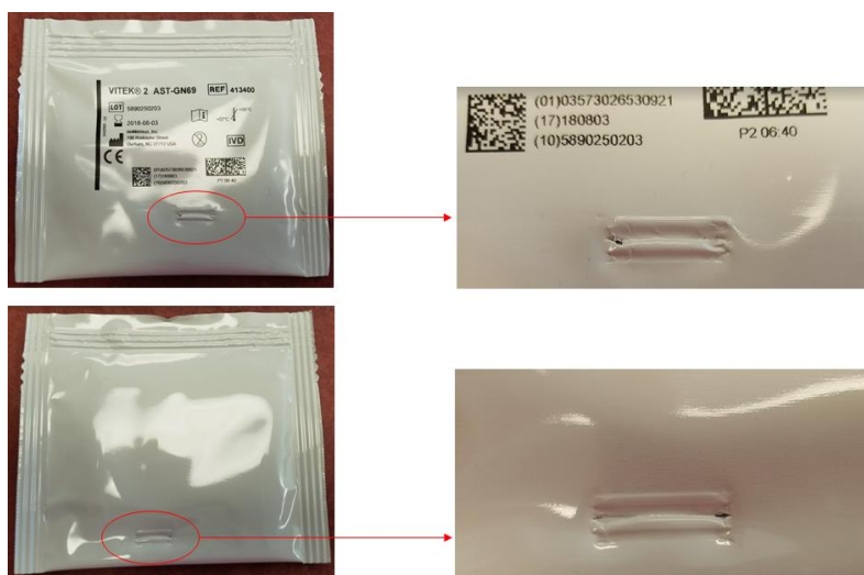
Figure A – Exemple de sachet défectueux

NB : La cause principale de cette anomalie a été identifiée et des mesures correctives ont été prises pour que les problèmes de ce type n'affectent pas les futurs lots de fabrication.