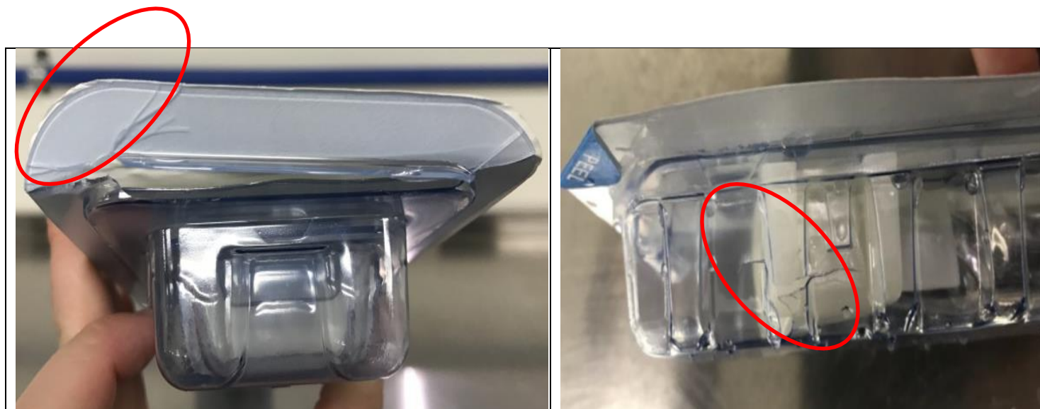
Fig 1. Bord de la barquette extérieure cassé

En cas de détérioration du carton et/ou de la barquette extérieure, il est très probable que le problème ait été identifié avant l'opération. La notice d'instructions fournie avec le dispositif ou le système de dispositifs inclut une section relative à la stérilité. Elle indique à l'utilisateur d'inspecter l'emballage et de ne pas utiliser le dispositif en cas de détérioration du joint ou de l'emballage lui-même.