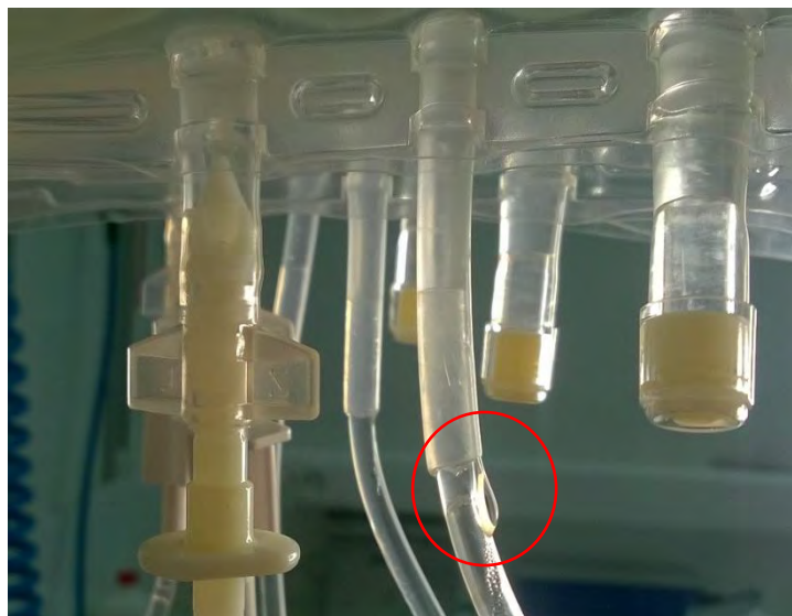
*photo de la fuite