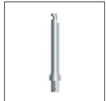
Tournevis à tête hexagonale RHD2.5

Screw-Vent®, Trabecular Metal™, SwissPlus®, Tapered SwissPlus® et AdVent® possédant un hexagone de 2,5 mm. Deux instruments, dont RH2.5 et RHL2.5, peuvent être utilisés à la place du RHD2.5. Veuillez à vous reporter aux manuels de chirurgie respectifs pour obtenir les instructions appropriées.