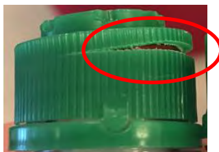
Image 1 Capuchon vert fissuré