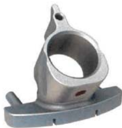
Figure 1 : guide de perçage NS798R

Les illustrations suivantes montrent le produit impliqué (Figure 1), le positionnement correct du guide de perçage (Figure 2) et l'ajustement correct sur le composant fémoral d'essai (Figure 3).