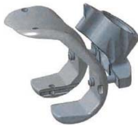
Figure 2: positionnement correct du guide perçage