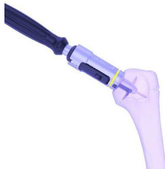
Illustration 1 – Préparation du greffon osseux à l'aide du coupe-greffon SMR.