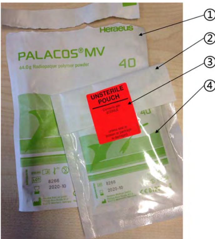
Photo : Description des parties du produit