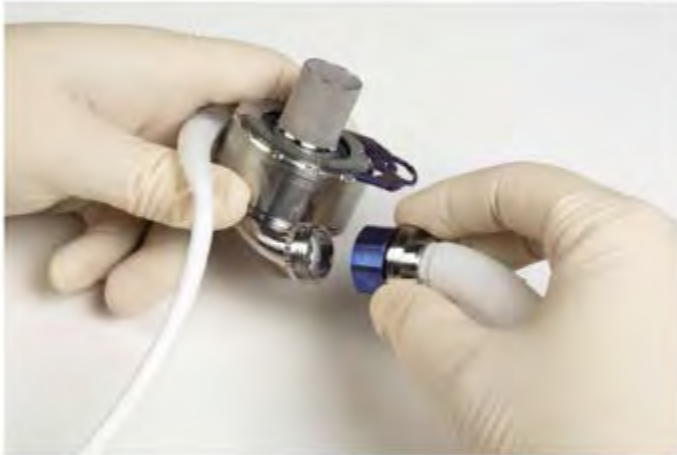
Figure 5.34 Raccordement du greffon