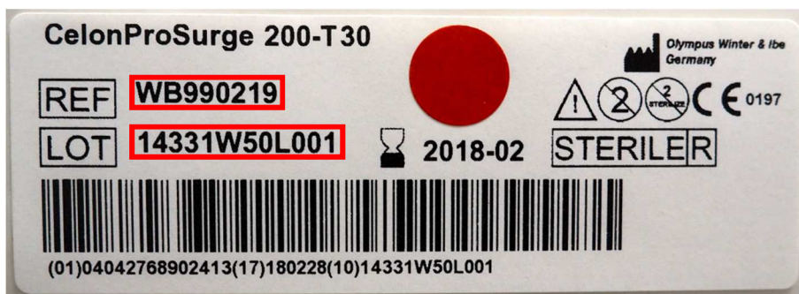
Image 4 : numéro de modèle (REF) et de lot (LOT) sur l'étiquette de l'emballage-coque