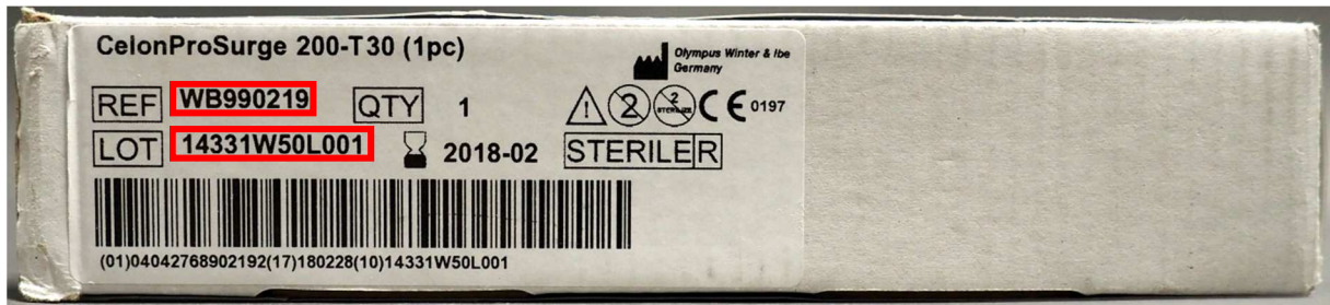
Image 2 : numéro de modèle (REF) et de lot (LOT) sur l'étiquette de l'emballage extérieur (vue latérale)