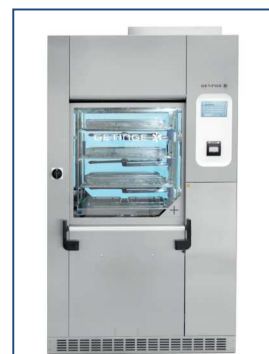
- Exemple de laveur-désinfecteur Getinge 86-Series -

Division Surgical Workflows-Infection Control