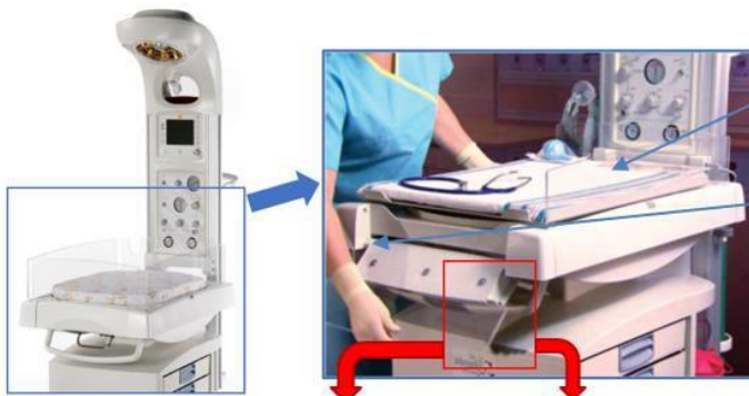
Figure 1A : panneaux latéraux de lit

AVANT CHAQUE UTILISATION DU PANNEAU DE LA PORTE : examinez les panneaux latéraux de lit, la zone de verrou ainsi que la zone qui relie le panneau au lit afin de détecter toute fissure ou tout endommagement (voir Figure 1B ci-dessous). Si un élément des panneaux latéraux de lit ou des verrous est endommagé ou fissuré (voir Figure 1C ci-dessous), cessez d'utiliser la table radiante.