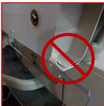
Figure 1C : verrou cassé