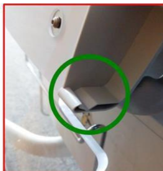
Figure 1D : verrou en état de fonctionnement