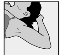
Guide de marquage